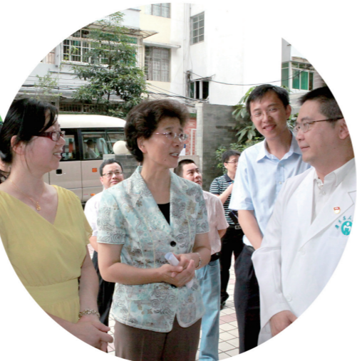
向省人民医院党员志愿活动负责人了解志愿服务开展情况