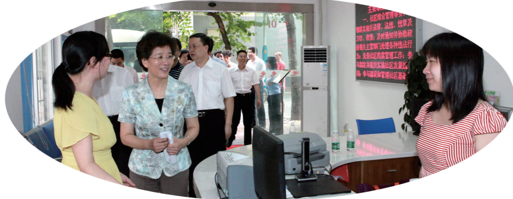
实地了解农林街东园新村社区服务站工作