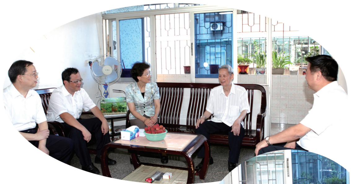
与副省长、省公安厅厅长李春生 慰问省公安厅老党员廖科芳同志