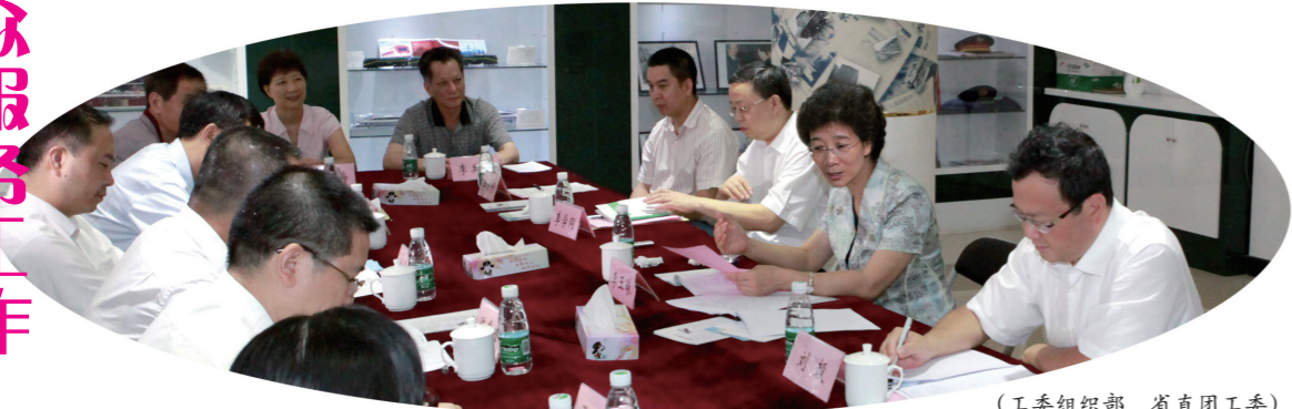
召开省直、区、街道、居委会党员代表座谈会