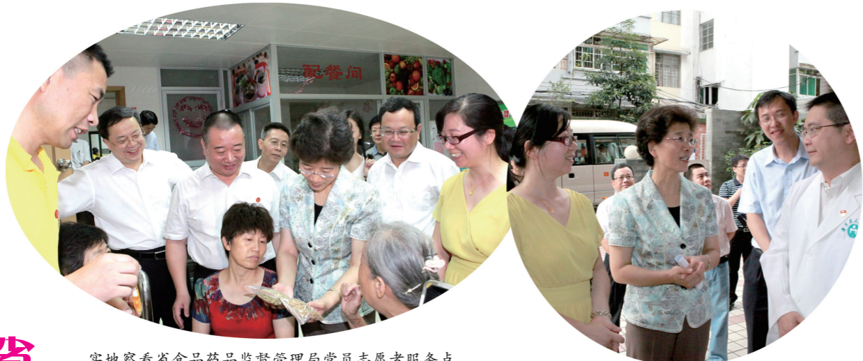
实地察看省食品药品监督管理局党员志愿者服务点