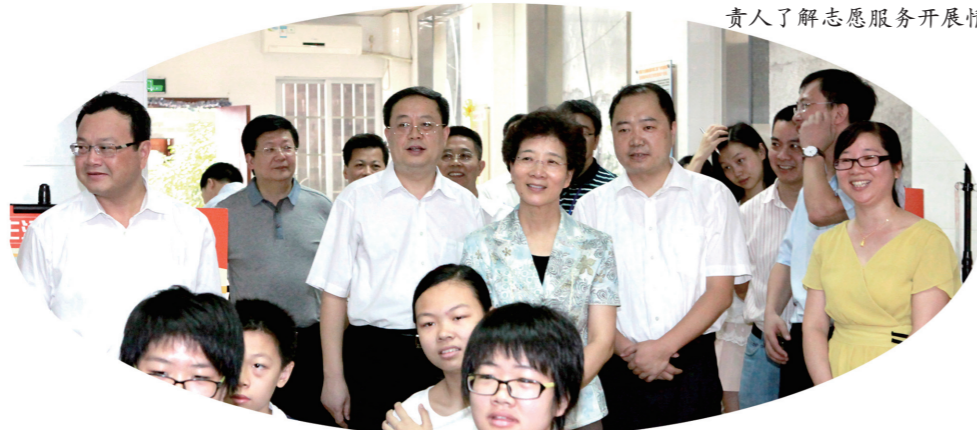
实地察看省气象局党员志愿者服务点