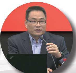
省委讲师团成员、省委宣传部副部长李斌