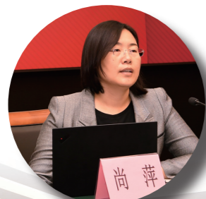
中央组织部组织二局四处处长尚萍

本次培训班为期2天，省直和中直驻粤各单位机关党委专职副书记，地级以上市委组织部、市直机关工委有关负责同志及省直机关工委全体党员干部共200余人参加现场培训，省直和中直驻粤各单位党支部书记、专职党务干部共3500余人通过广东省党员干部现代远程教育平台参加线上培训。