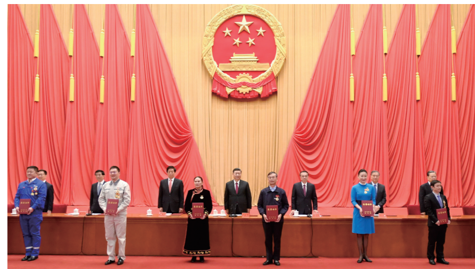
11月24日，全国劳动模范和先进工作者表彰大会在北京人民大会堂隆重举行。这是习近平等党和国家领导人向全国劳动模范和先进工作者代表颁发荣誉证书。