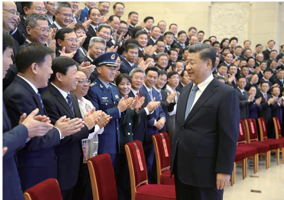
11月20日，党和国家领导人习近平、王沪宁等在北京会见全国精神文明建设表彰大会代表。

全国精神文明建设表彰大会20日在京举行。中共中央总书记、国家主席、中央军委主席习近平亲切会见参加大会的新一届全国文明城市、文明村镇、文明单位、文明家庭、文明校园以及未成年人思想道德建设工作先进代表，向他们表示诚挚问候和热烈祝贺。