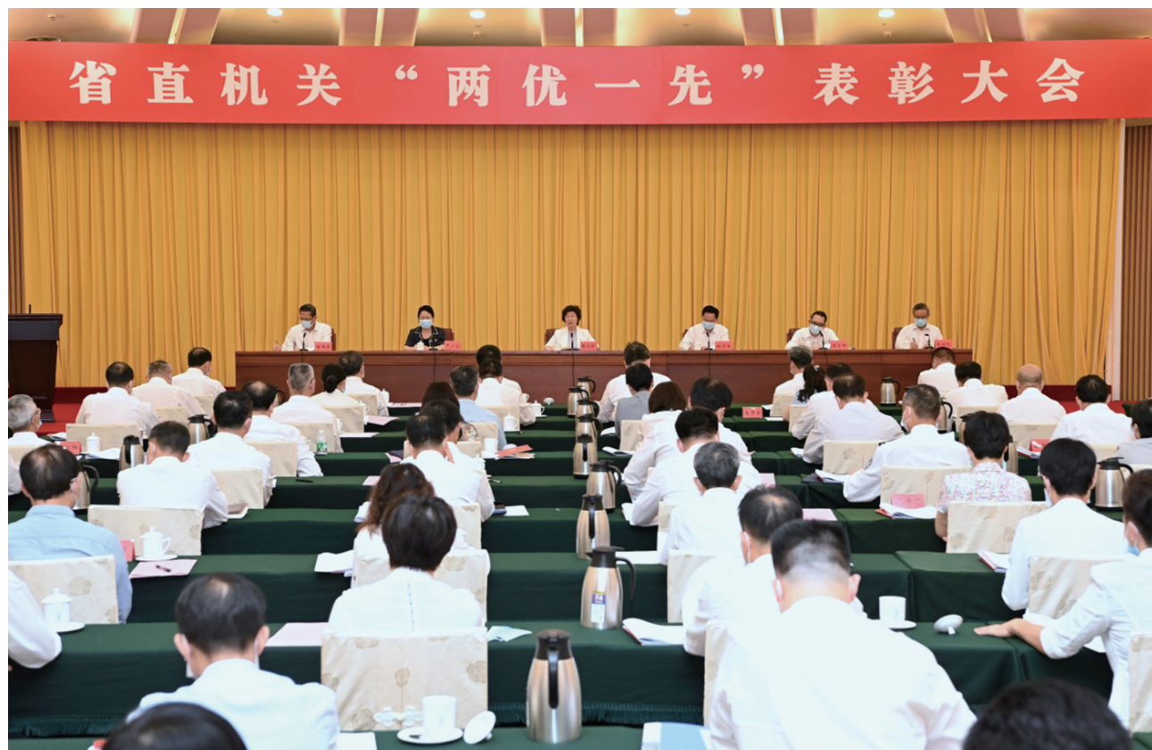
（责任编辑 韩东玲 余惠瑜）

会议表彰了省直机关100名优秀共产党员、100名优秀党务工作者和146个先进基层党组织。省财政厅、省交通运输厅、广州海关受到表彰的先进个人和先进集体代表分别作了交流发言。省直各单位机关党委书记、受表彰的优秀个人和先进集体代表参加会议。（省直机关工委组织部）