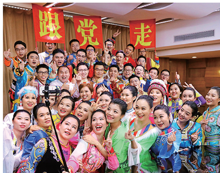
《心花怒放》 作者/祝桂峰

南湖一叶起春雷， 岂忍河山付劫灰。 拼死头颅酬壮志， 济穷华夏沐朝晖。 披荆斩棘险何惧， 换地翻天梦可追。 旗帜经霜红不改， 百年伟业永相随。