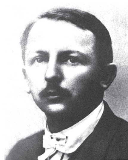
共产国际代表马林

20世纪20年代初，中国处于军阀割据、四分五裂的状态。中国共产党成立后，从中央到地方的各级组织都把主要精力投身于工人运动。1923年爆发的京汉铁路工人大罢工，是党领导的第一次工人运动的高潮。在“二七惨案”发生后，全国工人运动暂时转入低潮。严酷的政治、经济形势使中国共产党人进一步认识到，要推翻帝国主义和封建军阀的统治，仅仅依靠工人阶级的力量是不够的，应该联合孙中山领导的国民党，建立工人阶级和民主力量的统一战线。与此同时，孙中山在多次革命失败后也认识到，依靠军阀搞革命是不行的，中国国民党希望尽快找到新的盟友。国共合作水到渠成也势在必行。但是，对于国共合作，全党在思想上并未统一。因此，共产国际代表马林主张，把讨论国共合作作为中共三大的主题之一。