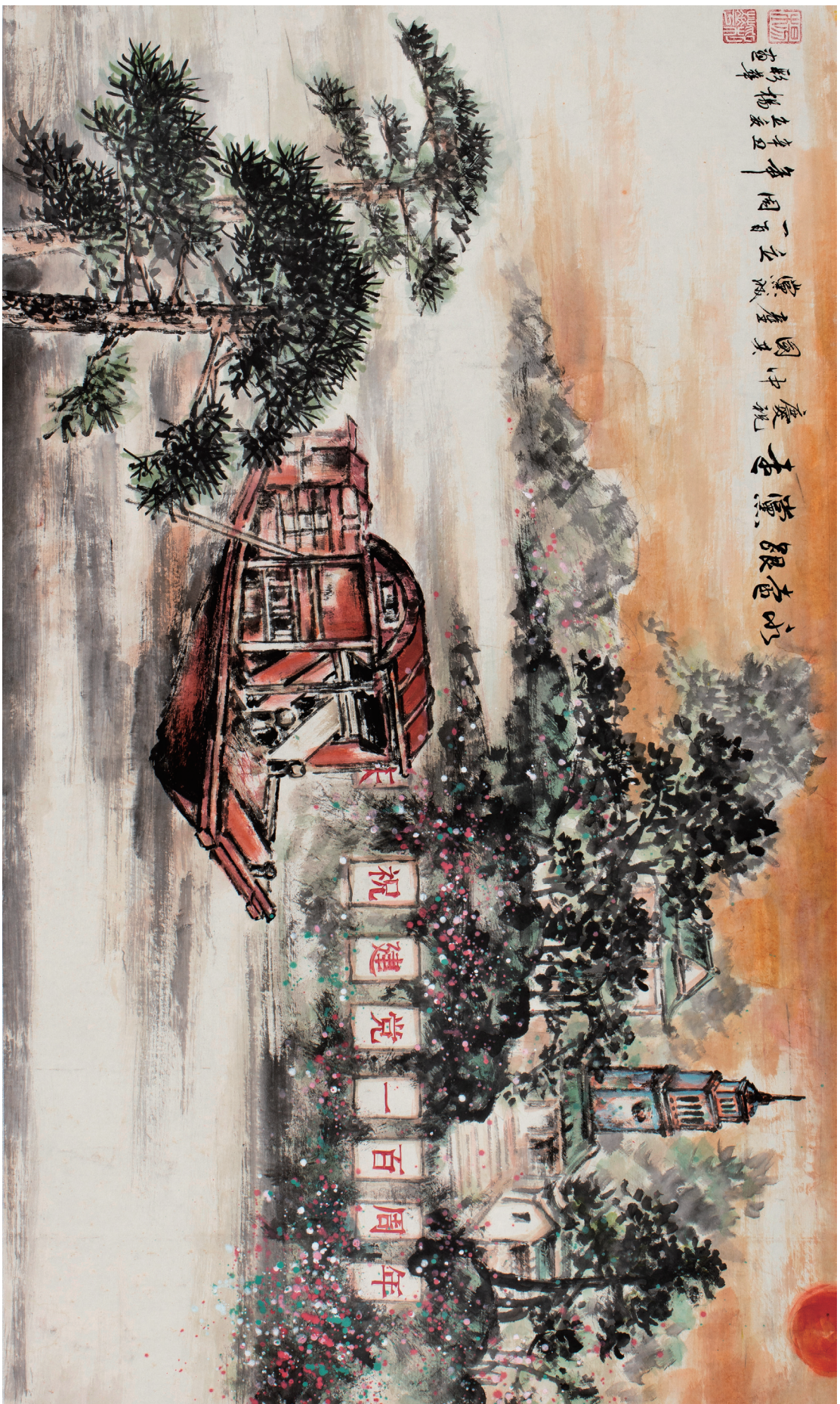
《永远跟党走》 作者/杨彩华