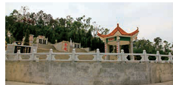
凤凰山烈士陵园中的报国亭

怀庵革命遗址位于东坑村的普陀寺内，占地面积约275平方米，原为一栋夯土墙房屋，现遗址仅存长20.1米、宽13.7米的方形夯土墙。1943年至1944年12月，广