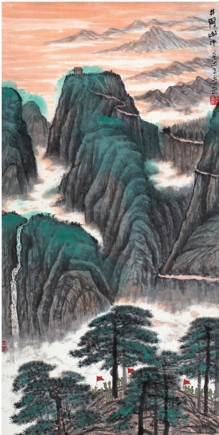
《井冈山中》 作者/吴玉春

——广东省直机关庆祝建党100周年美术书法摄影展作品选登 永远跟党走 奋进新征程