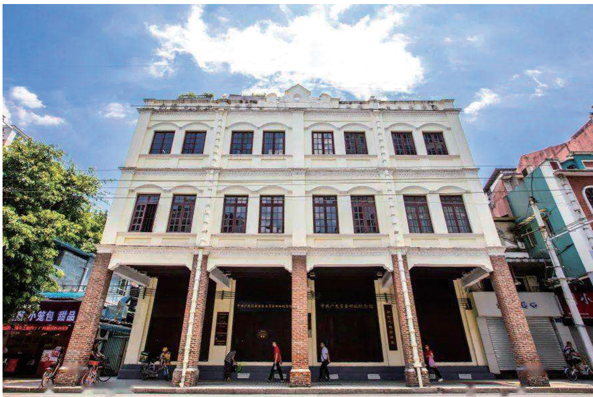
中共广东区委旧址纪念馆

中共广东区委是第一次国民革命时期中共的一个主要指挥阵地，这里诞生了中共历史上的四个“最”——最早成立的地区区委之一；最早建立了地方纪律检查机构；最早建立了地方军事运动机构；同时，也是最大的区委，管辖的范围最广、管理的党员人数最多，有力地组织、推动和影响了大革命的进程。