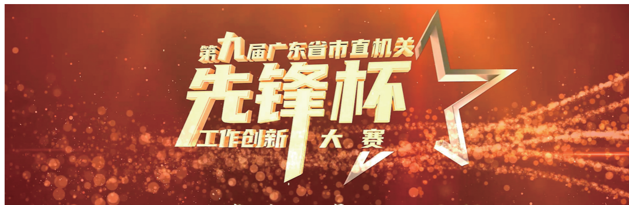
第九届广东省市直机关“先锋杯”工作创新大赛获奖作品