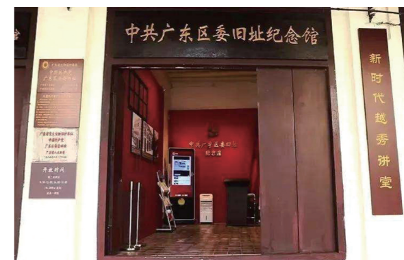
中共广东区委旧址纪念馆

任广东区委书记期间，陈延年在党的建设上倾注了大量心血。他派遣大批同志奔赴各地开展革命活动。在积极开展工农运动的同时，大力发展党的组织。在不到两年的时间里，广东党员数量从原有的几百人发展到5000多人。约占当时全国党员总人数的三