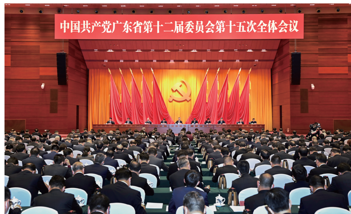
2021年12月21日，中国共产党广东省第十二届委员会第十五次全体会议在广州召开。

2021年12月21日，中国共产党广东省第十二届委员会第十五次全体会议在广州召开。会议的主要任务是：坚持以习近平新时代中国特色社会主义思想为指导，深入学习贯彻党的十九届六中全会和中央经济工作会议精神，深入贯彻落实习近平总书记对广东重要讲话和重要指示批示精神，总结2021年工作，部署2022年工作，奋力在实现习近平总书记赋予广东在全面建设社会主义现代化国家新征程中