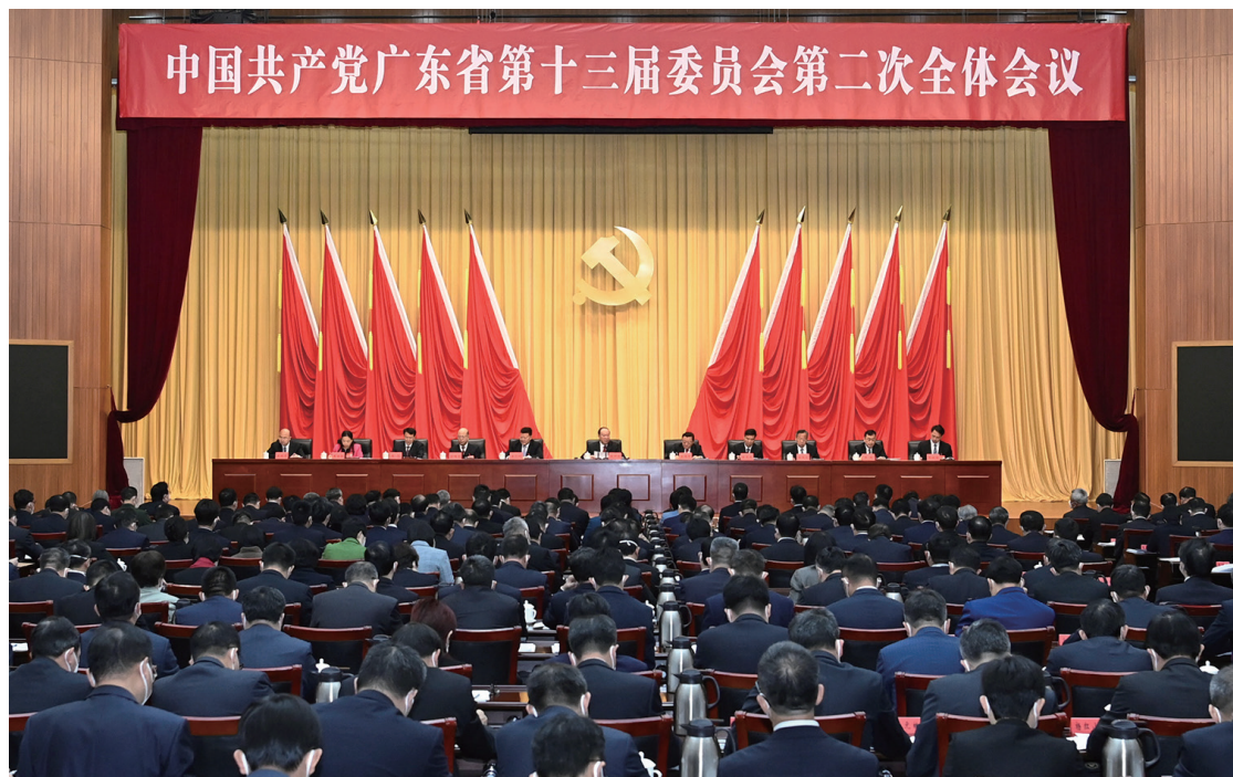
12月8日，中国共产党广东省第十三届委员会第二次全体会议在广州召开。

12月8日，中国共产党广东省第十三届委员会第二次全体会议在广州召开。会议以习近平新时代中国特色社会主义思想为指导，深入贯彻落实党的二十大精神，以高质量发展为牵引，高水平推进现代化建设，守正创新、团结奋斗，奋力推动广东在全面建设社会主义现代化国家新征程中走在全国前列、创造新的辉