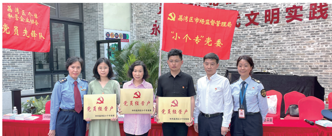
2021年3月，为永庆坊党员经营户授牌

习近平总书记在党的二十大报告中强调，要营造市场化、法治化、国际化一流营商环境。荔湾区“小个专”经济组织占全区市场主体的95%以上，是促进经济增长的税收潜力，也是保障民生福祉的就业海绵。针对当前中小微企业、个体工商户生存发展难题，为解决好“小个专”党建“抓不住”“抓不实”“抓不好”的问题，2021年，荔湾区成立中共广州市荔湾区小微企业、个体工商户、专业市场委员会（简称荔湾区“小个专”党委），积极探索新时代“小个专”发展新思路、新方法、新路径，以“党建红”激发“小个专”发展新动能，助推区域经济社会高质量发展。