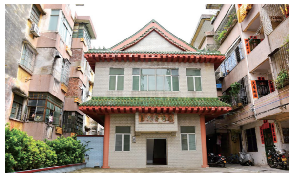
文昌宫——中共阳江县委旧址

文昌宫——中共阳江县委旧址，位于阳江市江城区南恩街道南恩路县前市11号，目前保存状况好，为广东省中共党史教育基地和阳江市爱国主义教育基地。