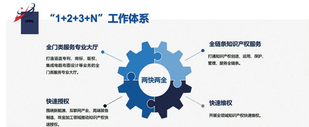
深圳知识产权保护中心“1+2+3+N”工作体系中的“一”个业务框架