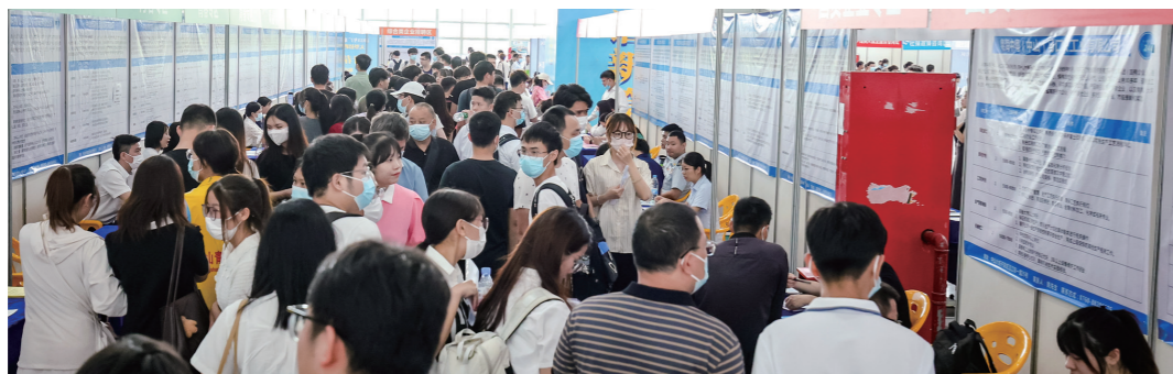
2023年5月20日，举办2023年广东“稳就业促发展”分片区大型招聘活动(中山)。

习近平总书记在江苏考察时强调，要坚持学思用贯通、知信行统一，匡正干的导向，增强干的动力，形成干的合力，在以学促干上取得实实在在的成效。省人社厅牢牢把握“学思想、强党性、重实践、建新功”总要求，紧扣省委“1310”具体部署，紧盯人民群众急难愁盼问题，聚焦事业发展堵点痛点，找差距、定目标、抓落实，在政策、机制、行动上形成一批实实在在的成果，切实以人社事业提质增效体现主题教育实效。