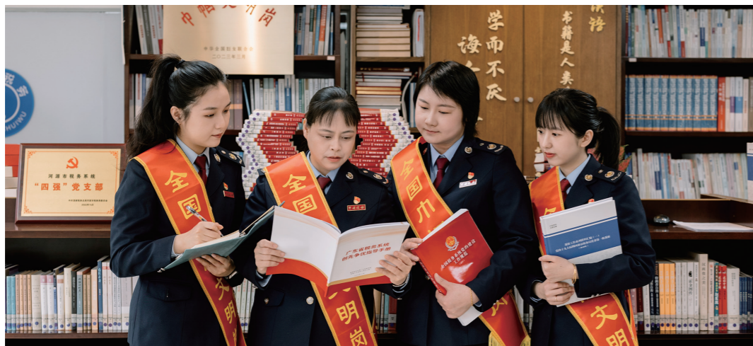
市税务局“四强”党支部发扬传帮带作用，夯实青年党员理论基础。

党的二十大报告强调，把基层党组织建设成为有效实现党的领导的坚强战斗堡垒。河源市税务局坚持以习近平新时代中国特色社会主义思想为指导，牢固树立“一切工作到支部”的鲜明导向，制定《河源市税务系统“四强”党支部创建实施方案》，以“四看四评”为度量，在全市税务系统评选出第一批共26个“四强”党支部，有效激发典型示范引领作用，推动基层党组织真正成为政治功能强、支部班子强、党员队伍强、作用发挥强的坚强战斗堡垒。