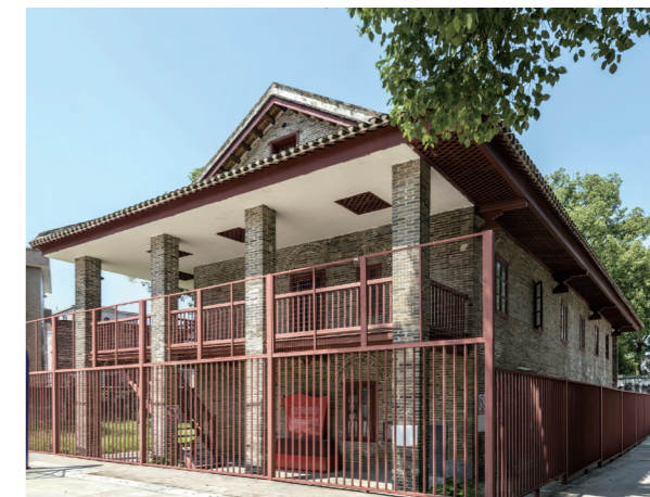
惠爱医院——红七军伤病员治疗处旧址

惠爱医院——红七军伤病员治疗处旧址位于连州市连州镇城西村双喜巷慧光中学校园内，是广东省文物保护单位、清远市首批不可移动革命文物保护单位和中共党史教育基地。