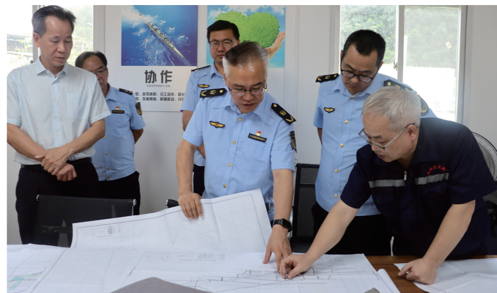
在茂名市调研督导矿山安全生产工作。

今年以来，国家矿山安全监察局广东局党组在主题教育中深入学习贯彻党的二十大精神和习近平新时代中国特色社会主义思想，强化党建引领，依法服务发展大局，深化矿山安全监察体制改革，聚焦广东省委“1310”具体部署，认真研究督政方式方法等有效防控事故对策措施，探索出一条党建引领“强督政、控风险、盯重点、精指导、重闭环、防事故”的非煤矿山安全监察新路子，有力促进辖区矿山安全生产形势持续稳定。