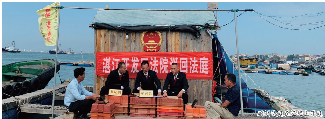
巡回法庭在渔船上开庭

党的二十大报告明确了全面依法治国的工作布局，湛江市中级人民法院党组深入贯彻习近平法治思想，坚持以人民为中心，让传统的“登闻鼓”换成司法“新鼓”，充分发挥人民法庭在社会基层治理上的主动作用，让大量基层矛盾纠纷通过前端防控体系止于未发、化于萌芽，实现“化讼止纷”为“少讼无讼”，助力打造更高水平法治广东。