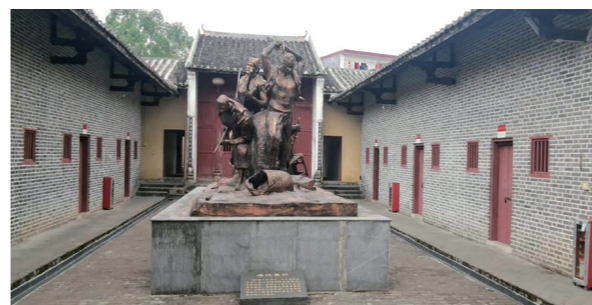
大同社学——鱼湾苏维埃政府旧址

大同社学——鱼湾苏维埃政府旧址位于英德市东华镇鱼湾行政村鱼湾小学旁，是清远市首批不可移动革命文物保护单位，也是清远市爱国主义教育基地和中共党史教育基地。