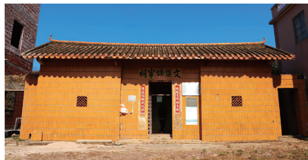
文谟钟公祠——石板乡农会旧址

清远是一片具有光荣革命传统的红色热土，在广东党的历史上有重要的历史地位。中国共产党在清远地区建立组织时间早、活动时间长、党员人数多，留下很多红色革命遗址。目前，清远市新民主主义革命时期红色革命遗址共532处（部分为遗址群），分布于清远的8个县（市、区），其中省级文物保护单位3个，县级文物保护单位40个；市级爱国主义教育基地16个，县级爱国主义教育基地9个。