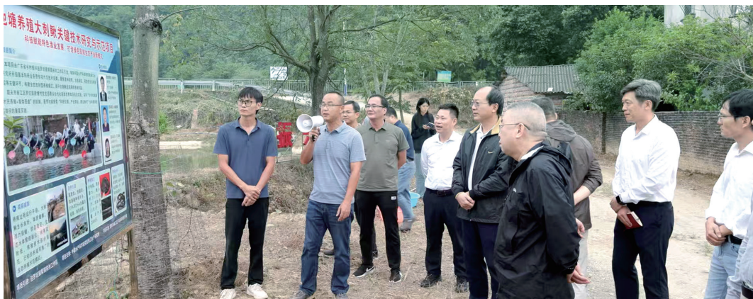
局领导带队深入韶关市曲江区罗坑镇，开展乡村振兴驻镇帮镇扶村工作专题调研

习近平总书记深刻指出：“机关党的建设是机关建设的根本保证。”省机关事务管理局深入贯彻习近平总书记关于党的建设的重要思想特别是关于机关党建的重要论述，直面党建和业务“两张皮”、日常监督乏力等“老大难”问题，以加强“一支部一品牌”创建、加强岗位廉政风险防控、加强内部审计为抓手，实现党建和业务高质量发展“双促进”，为全国机关事务领域开辟新鲜路径、提供“广东答卷”。