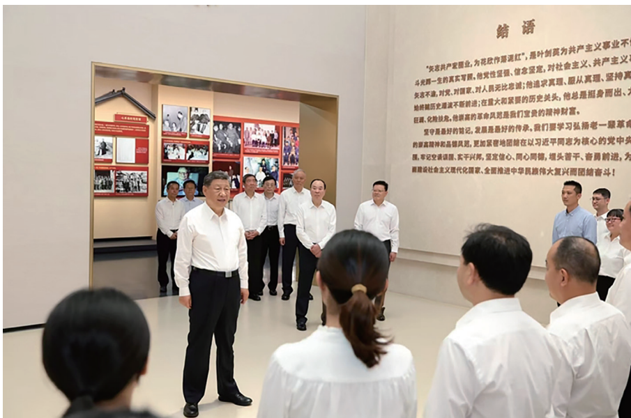
11月7日至8日，中共中央总书记、国家主席、中央军委主席习近平在广东考察。这是7日下午，习近平在位于梅州市梅县区雁洋镇的叶剑英纪念馆参观时，同工作人员亲切交流。

准确把握党中央精神，针对干部群众关注的问题释疑解惑。广东作为经济大省和发达地区，在编制“十五五”规划时要有高站位、大格局，体现走在前、作示范、挑大梁的责任担当