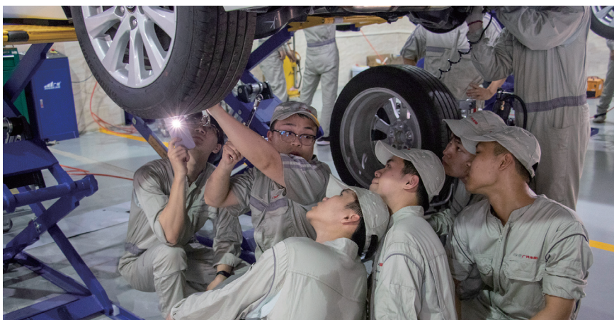
学院师生进行汽车维修教学

省轻工业技师学院党委深入践行习近平新时代中国特色社会主义思想，作为省直机关工委新一轮加强党的基层组织建设三年行动计划联系点，紧紧围绕“高质量党建引领高质量发展”这一主题，构建以“三项机制、三个抓手、四个品牌、五个强化”为路径的“3345”党建工作法，促进党建与业务深度融合，推动学院事业高质量发展。