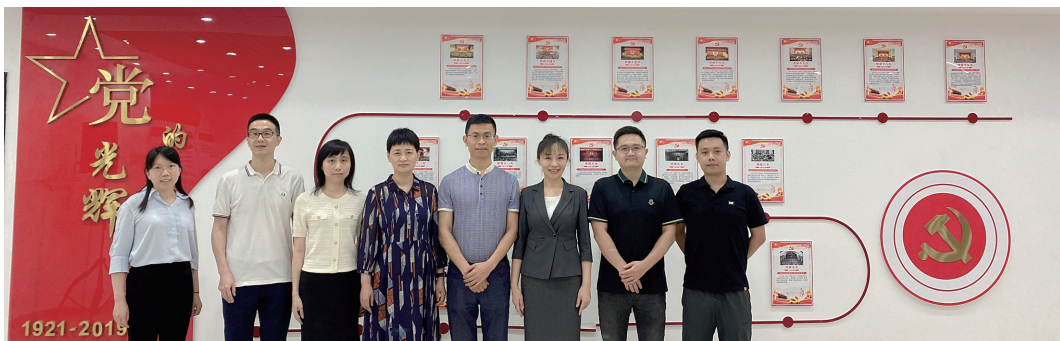
与天河法院党支部联学共建

广州知识产权法院商标及不正当竞争审判庭党支部坚持以习近平新时代中国特色社会主义思想为指导，聚焦落实省委“1310”具体部署，以加强党的政治建设为统领，以建成政治功能强、支部班子强、党员队伍强、作用发挥强的“四强”党支部为目标，以提升组织力为重点，全面落实新时代党的建设总要求和新时代党的组织路线，持续推进党建工作与审判工作深度融合，以高质量党建工作推进高质量知识产权审判工作成效显著，先后荣获全国“人民法院党建工作先进集体”、省直机关“先进基层党组织”、全省法院“知识产权审判工作表现突出集体”等荣誉，2024年被省直机关工委命名为“四强”党支部。