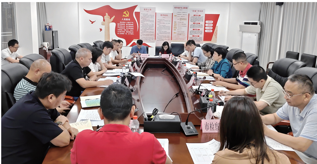
市直机关工委召开《民生直通车》群众投诉问题专题协调会，与相关业务部门负责人就未办结问题进行专题沟通协调

悠悠万事，民生为大。习近平总书记指出：“家事国事天下事，让人民过上幸福生活是头等大事。”由佛山市直机关工委主办、佛山市新闻传媒中心承办的《民生直通车》节目自2005年开播以来，20年来始终坚持“民有所呼、我有所应”，把群众的急难愁盼摆上台面，让部门的责任担当落在实处，不仅是佛山党情政务公开的“窗口”，更是市直机关单位直接联系群众、俯身听民意、躬身解民忧的“连心桥”。