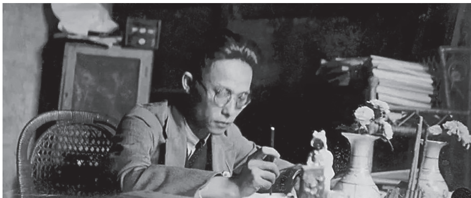
正在伏案工作的阮啸仙

阮啸仙是首届中央监察委员会候补委员，也是我国人民审计制度的创建者和奠基人。1934年，他当选为中华苏维埃共和国第一任中央审计委员会主任。他坚持一身正气，敢于动真碰硬，赢得了红军战士和老区群众的信任和敬重。至今在江西瑞金还传唱着一段顺口溜：“阮啸仙，真过硬，审计肃贪是能人，群众见了哈哈笑，贪贼见到失了魂。”