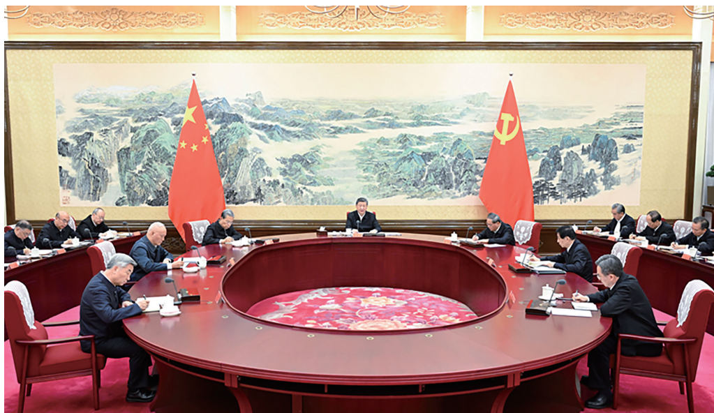
12月25日至26日，中共中央政治局召开民主生活会，中共中央总书记习近平主持会议并发表重要讲话。

贯彻新发展理念，加快构建新发展格局，着力推动高质量发展，进一步全面深化改革，更好统筹发展和安全，推动经济实现质的有效提升和量的合理增长，持续改善民生，保持社会和谐稳定，纵深推进全面从严治党，努力实现良好开局