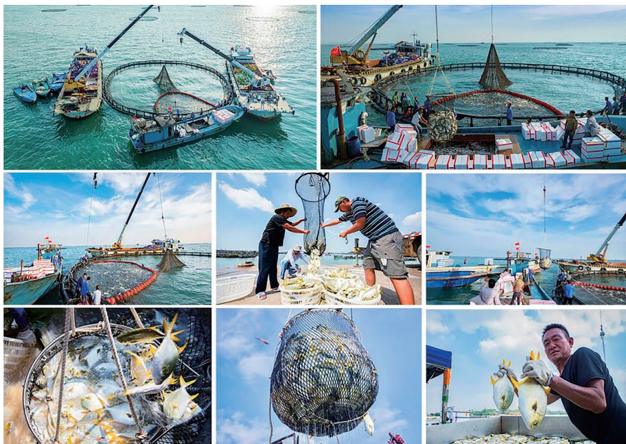
《蓝海牧场的丰收答卷》(组图)