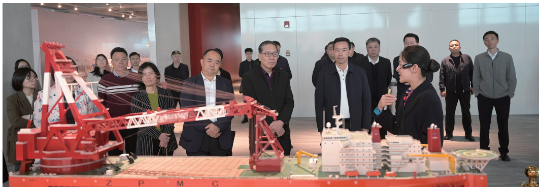
港珠澳大桥口岸展厅现场研学

12月4日至5日，省检察院在珠海举办深入打造广东检察机关“沿着习近平总书记视察广东的足迹”研学路线座谈会，全省22个市级检察院政治部主任和省检察院政治部有关部门负责同志参会，交流推广各地紧贴检察实际打造研学路线经验做法。