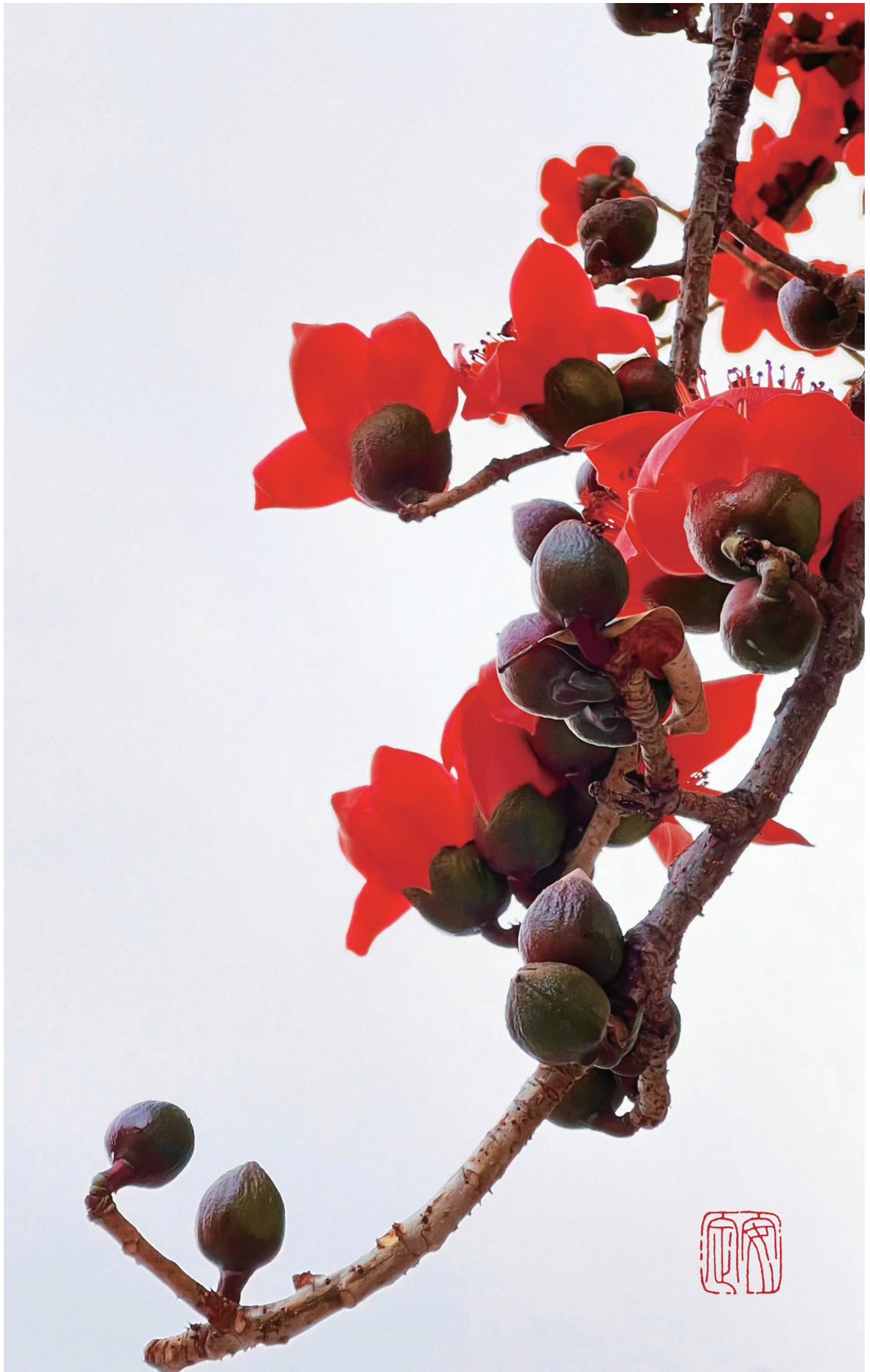
《英雄木棉》