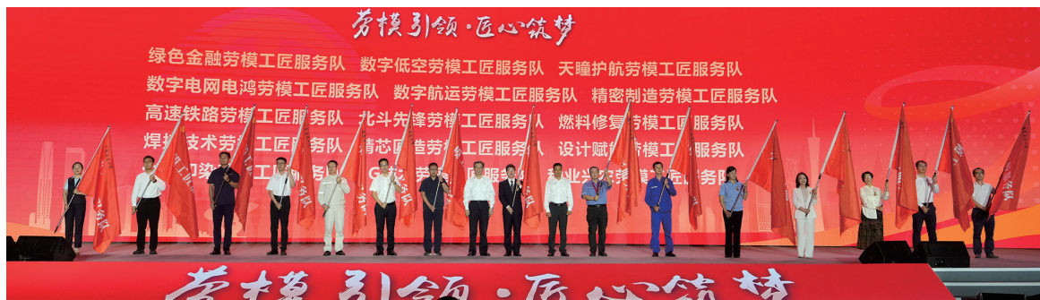
“劳模工匠进万企 助力现代化产业体系建设”专项行动启动仪式