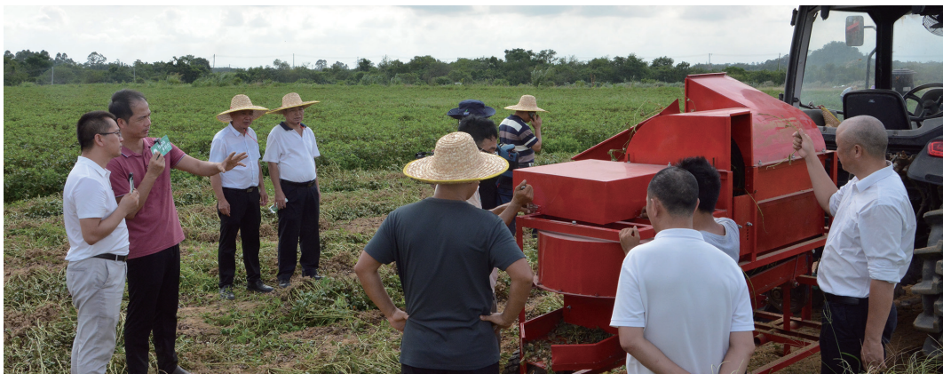
花生全程机械化生产示范与技术指导

小小花生，虽为寻常作物，却系国之大者，它关乎国家油料安全的战略底线，承载着端牢中国饭碗的政治责任，更连接着千万农民的致富梦想。省农业科学院作物研究所花生研究室党支部紧紧围绕国家粮食安全、创新驱动发展和乡村振兴战略，深入贯彻省委“1310”具体部署，以创建“四强”党支部为抓手，坚持把论文写在大地上，持续推动党建与科研深度融合，将科技创新的“关键变量”转化为产业振兴的“最大增量”，让小小“金豆”真正成为乡村振兴的“致富豆”。