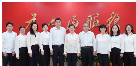
广东省民政厅儿童福利处