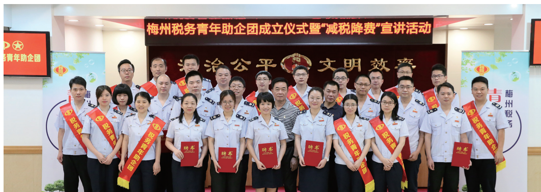
梅州市税务局成立青年助企团

聚焦“怎么学”，明确机制求实效。 坚持党管青年工作原则，创新方式方法，采取个人自学与集中学习相结合、线上学习与线下学习相结合、“走出去”与“请进来”相结合、理论培训与实践调研相结合等形式组织开展学习活动。探索建立领导领学与青年参学相结合的机制，强化党员领导干部对青年理论学习的示范引领，适时安排青年干部列席理论学习中心组专题学习会。明确机关党委（党总支、党支部）要承担本单位青年理论学习小组的日常管理，对学习主题、内容、形式等加强审核把关，推动形成体现机关特色、符合青年特点、具有时代特征特色品牌，切实把学习成果转化为梅州高质量发展的实效。如梅州自2023年底开始组织市县机关“百名干部进百企”，开展驻企体验服务工作，提高精准服务企业的质量和水平，助力民营经济高质量发展。1074名机关青年党员干部挺膺担当、主动服务，已开展11批驻企工作，驻点服务1074家“四上”（含拟培育）企业，累计收集梳理人才引进、产业扶持、用地保障等问题1089条，其中861条得到迅速解决，为梅州打造全国最优最快政务服务环境贡献了青年担当。相关经验做法得到市委、市政府主要领导肯定批示，并被《中国组织人事报》《广东每日汇报》采用刊发。跨