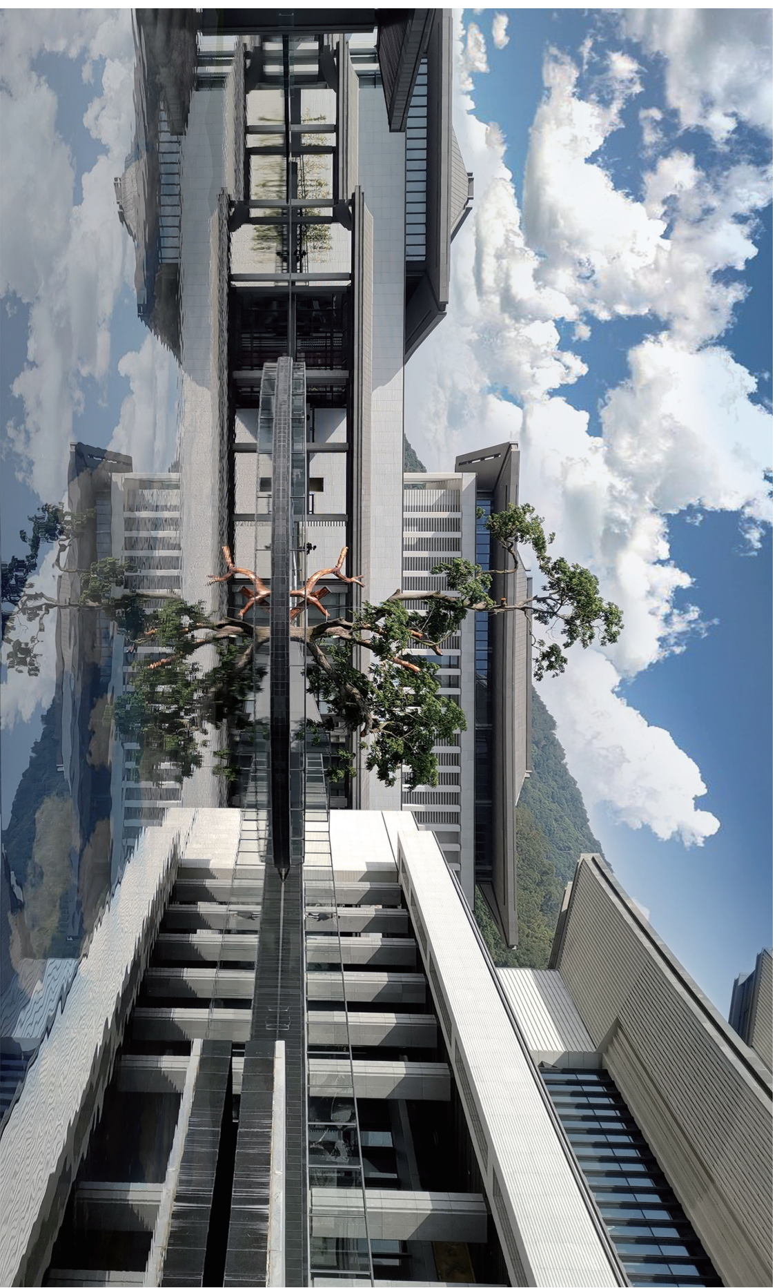
《流溪河水映文心》