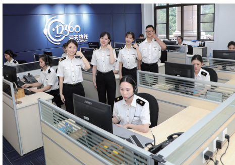
广州海关办公室政务公开科