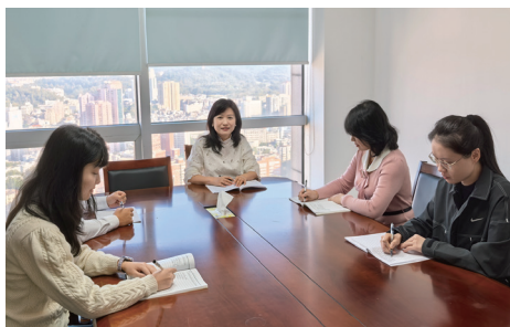
广东省人力资源和社会保障厅法制处

广东省人力资源和社会保障厅法制处成立于2009年，秉持法治人社初心，坚守为民服务宗旨，以法护航、服务民生，用法理温情守护群众切身利益，全力推动人社法治建设走在前列。全省人社领域省级地方立法21部，保有量全国第一，建立民意聚合机制、精准立法机制，建成20余个基层立法联系点，近3年推动省社会保障卡居民一卡通条例、省技能人才发展条例等5部条例出台修订，多项立法实现“全国首创”。近3年出台规范性文件123份，数量居省直单位首位，全面破解民生堵点，实现文件全周期智能监管“零差错”。构建“固定阵地+流动宣讲+线上矩阵”普法品牌体系，年均开展普法宣讲数万场。曾荣获全国“八五”普法中期突出单位、全国法治人社示范创建优秀单位等荣誉。跨