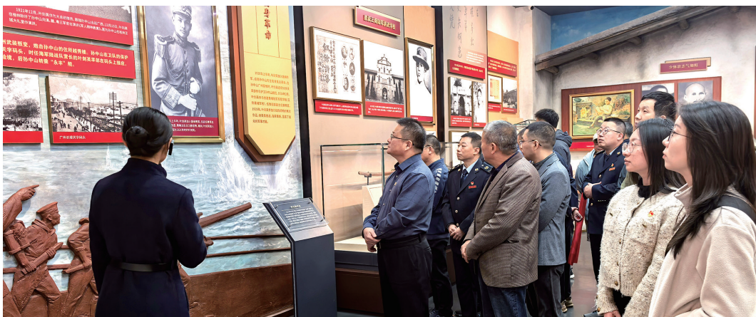
梅州市税务局组织青年到叶剑英纪念园参观学习

2025年11月7日，习近平总书记专程来到梅州视察，强调要教育引导广大干部群众特别是青少年传承红色基因、赓续红色血脉，永远听党话、跟党走。梅州市直机关广大党员干部牢记习近平总书记的殷殷嘱托，感恩奋进，自觉扛起沉甸甸的历史责任，持续深化青年理论武装，扎实做好机关青年理论学习工作，切实推动年轻干部成为习近平新时代中国特色社会主义思想的坚定信仰者和忠实实践者，努力让老区苏区人民日子越过越甜美。