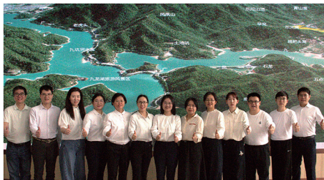
广东省国土资源技术中心国土资源数据室

广东省国土资源技术中心国土资源数据室成立于2001年，团队坚持以“数据赋能、服务为本”为宗旨，20多年来咬定青山不放松，为自然资源管理和数字政府改革提供坚实的数据支撑。连续多年在数据采集、数据库建设、数据共享应用等环节开展技术攻坚，建成全国领先的自然资源三维时空数据库，构建覆盖省市县三级、含1500余图层的数据体系，月均服务调用超2亿次，支撑国土空间规划、用途管制等核心业务，持续深耕数据服务领域，用专业能力保障自然资源“高效办成一件事”，通过“粤政图”“天地图”平台服务260余家单位、12万用户。曾荣获广东省工人先锋号、广东省“巾帼文明岗”、全国测绘科技进步奖、中国地理信息产业优秀工程金奖等荣誉。